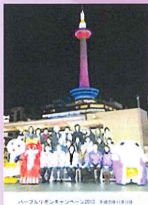
立命館大学チアリーダー部による点灯宣言