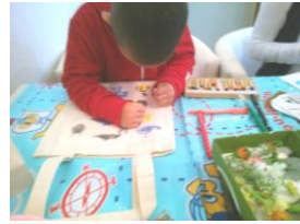
アートワークの様子